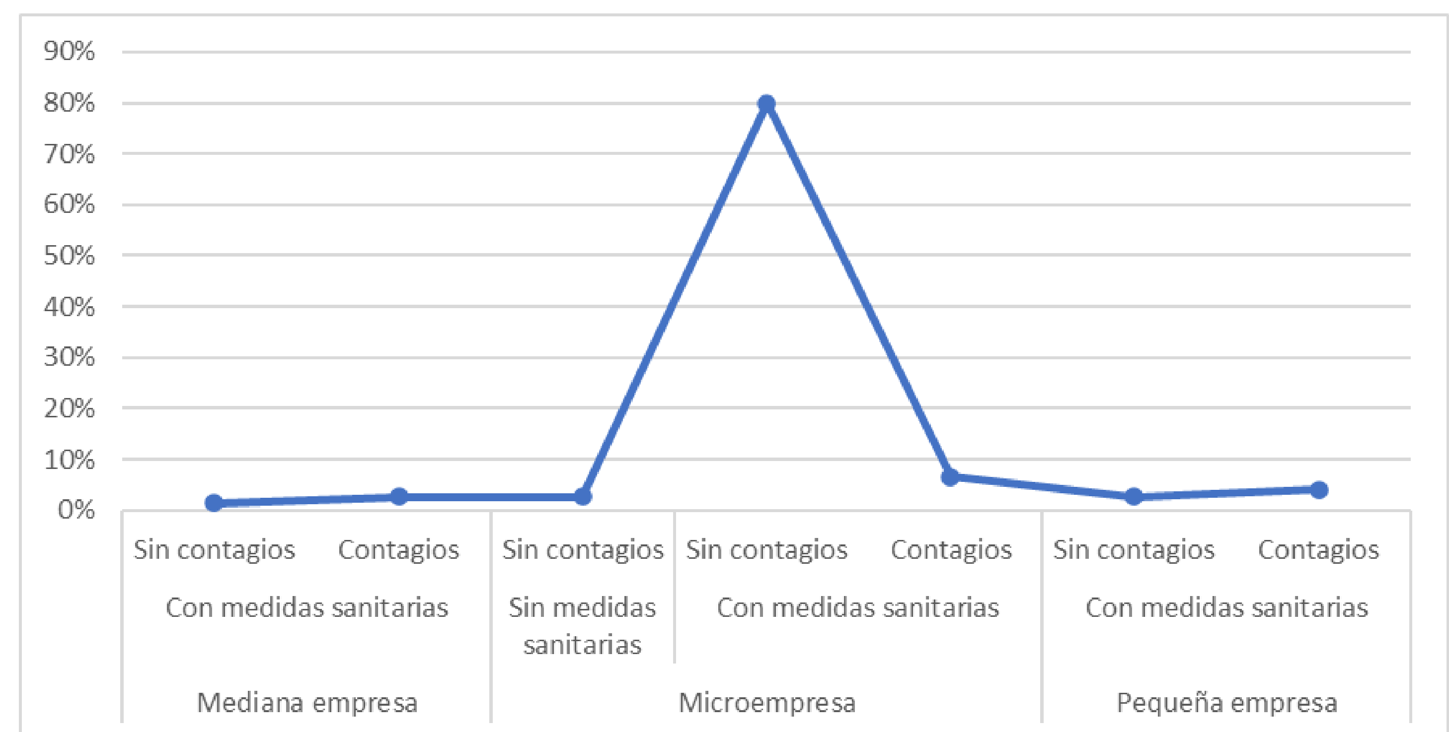
Figura 2. Contagios en empleados y pérdidas de ingresos por MiPymes

En la figura 1 se muestra que el 68% de las MiPymes que no implementaron ventas por internet tuvieron una disminución de sus ingresos mientras que solo un 21% de las MiPymes que implementaron ventas por internet o plataformas digitales tuvieron disminución en sus ingresos.